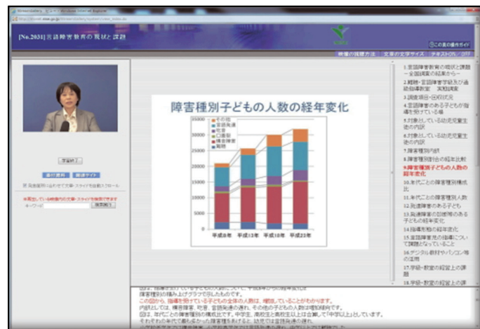
A page of an online lecture

These training contents are offered to schools and relevant institutions and require registration at NISE before they can be used.