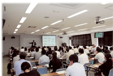
Lecture for specialized training

* Including participants who have completed the former program "Training Programs for Special Education intended for mid-career."