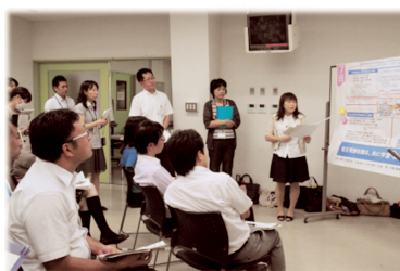
Group presentation for research outcomes