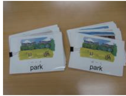
図3 特別支援学級での事前学習において使用した単語絵カード(注:ひらがな版とカタカナ版があり、子供の実態に合わせて使い分ける)