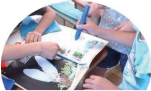
図2 昆虫の写真の隅に貼られた音声シールの音声を VOCA-PEN を使って聞いているところ(注:音声シールには、昆虫の名前やクイズが録音されている)