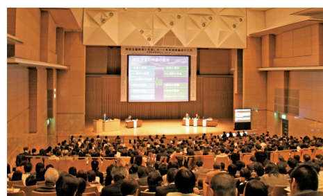
研究所セミナーの様子 NISE seminar

特別支援教育研究の動向や最新研究成果の普及、あるいは今日的課題や今後進むべき方向を探るため、第一線で活躍している研究者、専門家及び本研究所職員など特別支援教育関係者による講演、研究発表、パネルディスカッション、参加者との研究協議等を行います。