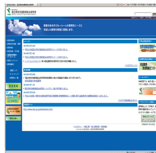
アクセシビリティ支援ツールを使用した 本研究所Webページ NISE website using an accessibility support tool

NISE provides information through seminars, publications, a website, and an e-mail magazine to distribute the results of the latest research on special needs education and promote awareness of children with disabilities. NISE accumulates, pigeonholes, and presents books, materials, and information on special needs education.