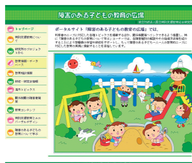
ポータルサイト 「障害のある子どもの教育の広場」 Portal site "Education Plaza for Children with Disabilities"