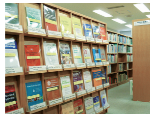
図書室の様子 Inside of the Library