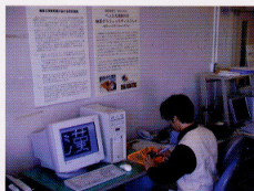
視覚障害児のためのペン入力機能付き 触覚グラフィックディスプレイ —電子レーズライターシステム—

Educational and Information Technology has contributed to the enhancement of the learning of children with disabilities. It has become our significant challenge in education to develop children's information literacy such as gathering, managing, and using various information appropriately by utilizing the Internet and other information devices in various settings. This department is pursuing its missions by 1) developing a variety of educational and assistive technology devices in order to provide special education students with easy access to necessary information and communication activities, 2) developing and evaluating school curriculum for teaching computing to children with disabilities.