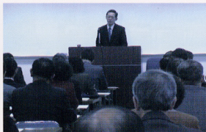
新任特殊教育諸学校等 校長・教頭講習会講師と参加者