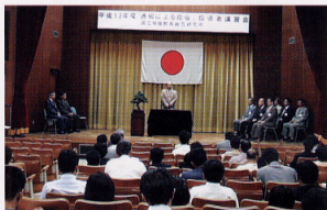
「通級による指導」指導者講習会 講師と参加者