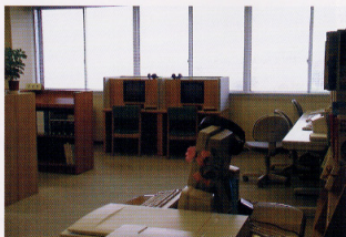
図書室所蔵ビデオテープの専用再生機