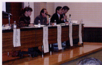
特殊教育セミナーパネリスト