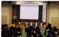
特殊教育セミナーパネリストと参加者