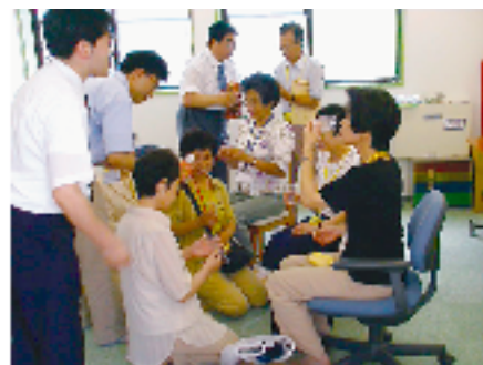
重度重複障害児に対する摂食の体験

Various themes have been taken up, and the following are some such examples: maintenance and enhancement of health; impact of needs arising from the accompaniment of sensory impairments; educational support for children with severe intellectual and physical disabilities; collaboration among home, school, welfare and medical sectors, etc.