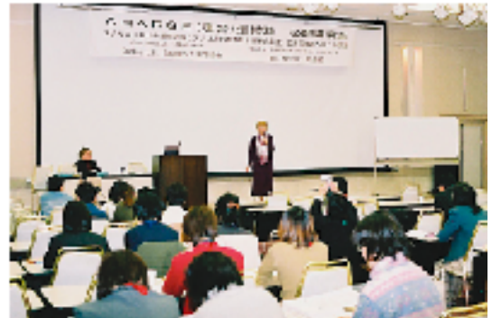
海外研究者との研究活動