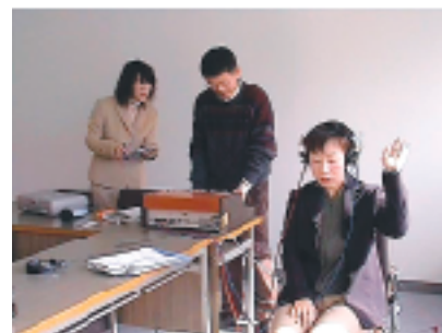
聴覚検査機器の指導

In the field of education for the speech handicapped, we have conducted clinical studies on educational intervention and practical assistance for children through case studies, reconsidering "speech disorder" as "communication disorder" so that these studies could be informative to classroom teachers.