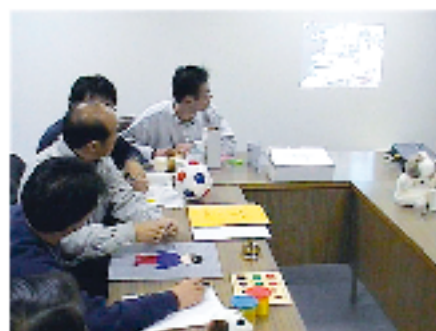
研修員との自閉症児用教育診断検査の評価の検討

Recently, studies on the education for children with ADHD have been emphasized to meet the increasing social needs. This department is also investigating actual condition of children with the emotional disturbance in regular classes and developing methods of assessment and treatment for them to cope with the extending field of special education.