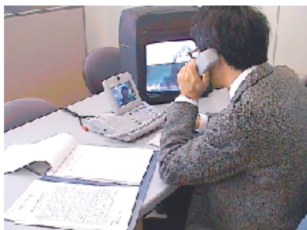
テレビ電話による学校のコンサルテーション