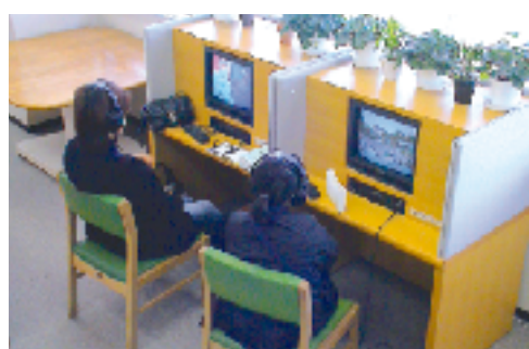
図書室所蔵ビデオテープの専用再生機