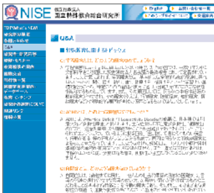
ホームページ「Q & A」画面

E-mail services are used for information exchange among our staff and many researchers and educators on special education and SINET (Science Information Network) enable them domestic and international information exchange. Database services are available through the NISE Web pages.