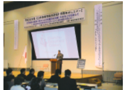
特殊教育セミナー基調講演