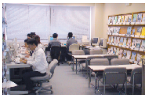
ブラウジングコーナーでの情報検索

(備考) 雑誌種類数 / 和 1,296種 / 洋 472種 Periodicals / Japanese / Foreign