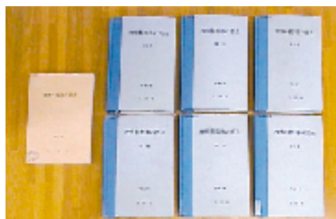
墨字本(左)と点字本(右)