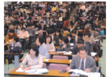
特殊教育セミナー参加者