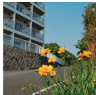
写真：宿泊棟外観，宿泊棟居室，食堂