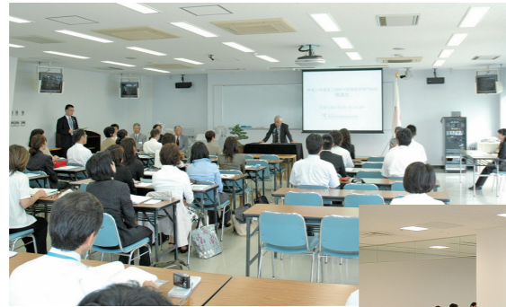
研修の様子 Training scene