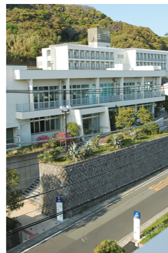
研修棟外観 Training facility