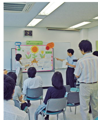
専門研修成果報告の様子 Presentation of training results

* 所内で行う研修事業の参加者は、原則として、研修員宿泊施設に宿泊して研修することとなっている。