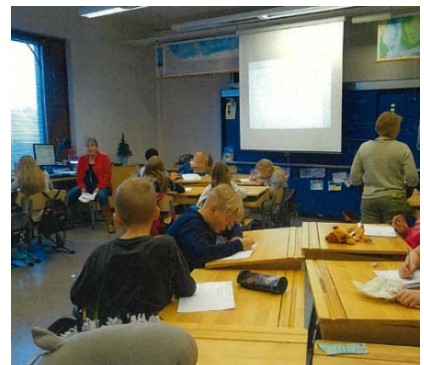
基礎学校の通常の学級における、 2人の教諭によるチーム・ティー チングの様子