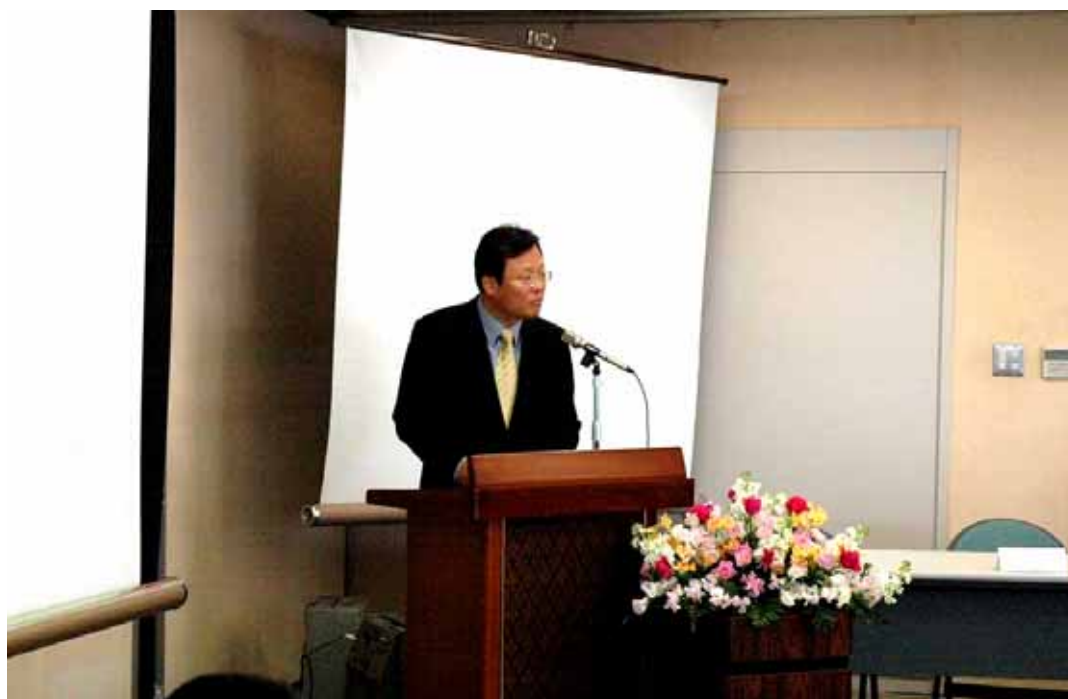
テ - マ1について発表をされる金容郁韓国国立特殊教育院長