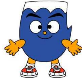
静岡県イメージキャラクター「ふじっぴー」