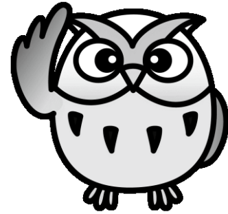
京都府総合教育センターマスコットキャラクター 「センタ君」