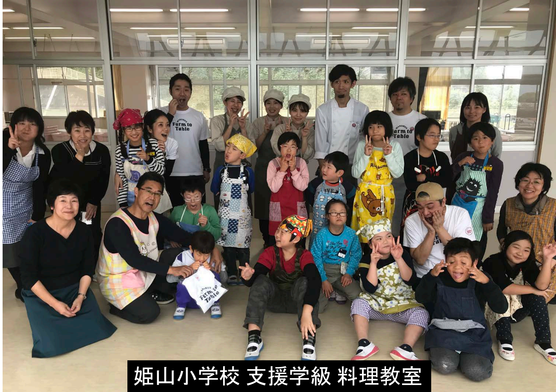
姫山小学校 支援学級 料理教室