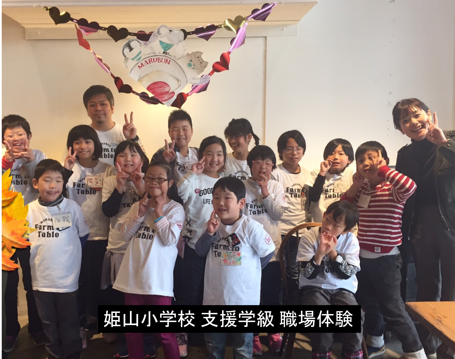
姫山小学校 支援学級 職場体験