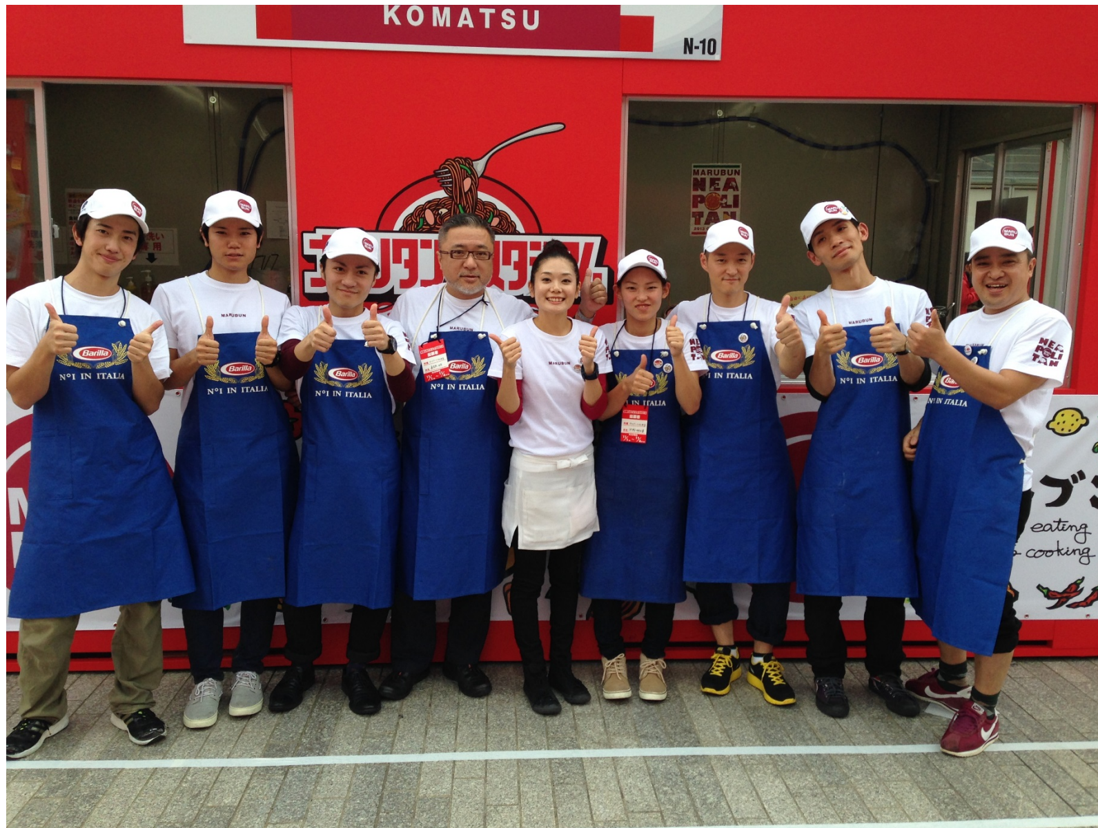
2013年11月2～4日 横浜赤レンガ倉庫