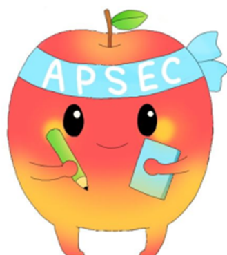
青森県総合学校教育センター イメージキャラクター アップセくん

期日 令和2年10月30日(金) 主催 全国特別支援教育センター協議会 主管 青森県総合学校教育センター 後援 文部科学省 青森県教育委員会