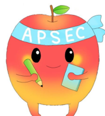
青森県総合学校教育センター イメージキャラクター 「アプセくん」