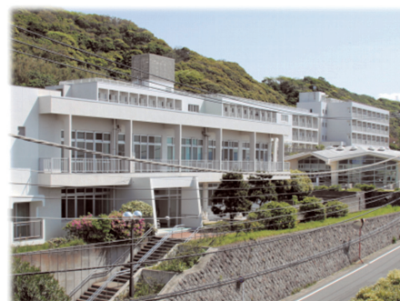
Building for In-service Training