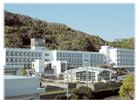
研修員宿泊棟及び食堂棟