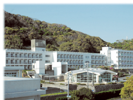
Dormitory for In-service Trainees and Canteen