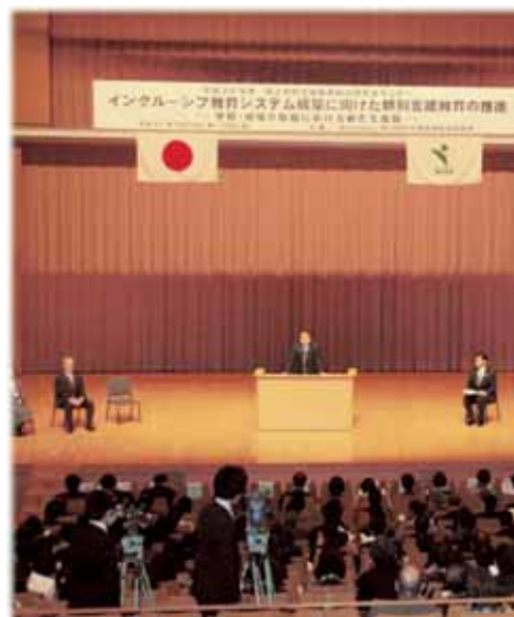
Opening ceremony of NISE seminar

Venue: National Olympic Memorial Youth Center