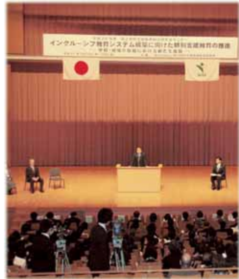
研究所セミナー開会式