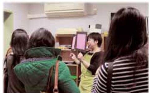
生活環境面での身近な配慮や支援の工夫の紹介