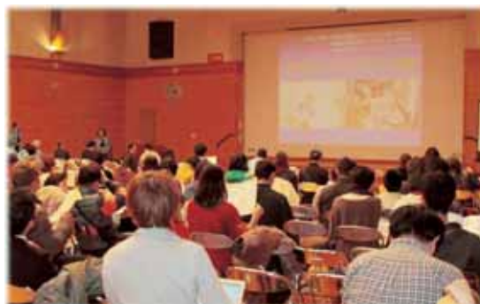
世界自閉症啓発デー in 横須賀

さらに、NISEでは、世界自閉症啓発デーに関連した地域イベントとして、相互協力機関である筑波大学附属久里浜特別支援学校とともに、平成22年度から「世界自閉症啓発デー in 横須賀」を開催しています。本イベントの実施に際しては、平成23年度から、共催団体として筑波大学附属久里浜特別支援学校PTA及び横須賀地区自閉症児・者親の会「たんぼぼの会」も運営に当たっています。