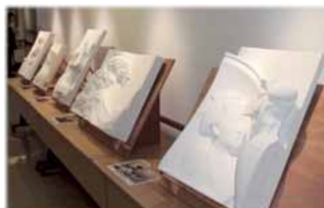
"Touch Images" for the visually impaired