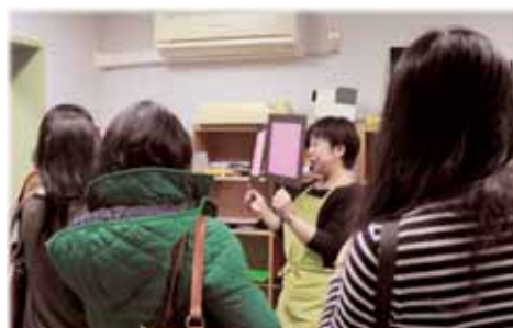
Introduction of devices for familiarity considerations and support in the daily life environment