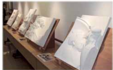
視覚障害者のための「触れる絵画」