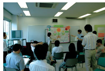
専門研修成果報告の様子

昭和46年の本研究所の創設と同時に研修事業を開始して以来、平成24年3月31日現在、1年間の研修は971名、約2ヶ月間の研修は8,098名、その他の研修は8,741名が修了しており、多くの方が各学校現場や教育行政機関等で活躍されています。