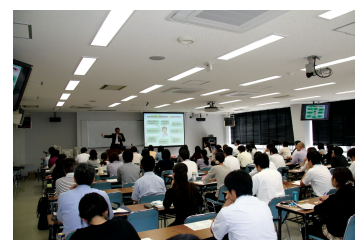
At a lecture