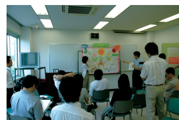
At a presentation of study results

NISE started providing teacher training programs immediately after its foundation in 1971. As of March 31, 2012, 971 participants have completed the one-year programs, 8098 participants, the two-months programs, and 8741 participants, other programs. Many of them who have completed NISE's teacher training programs are playing a leading role at schools, educational administration agencies and relevant institutions.