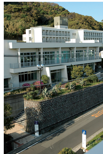
The Building for Teacher Training