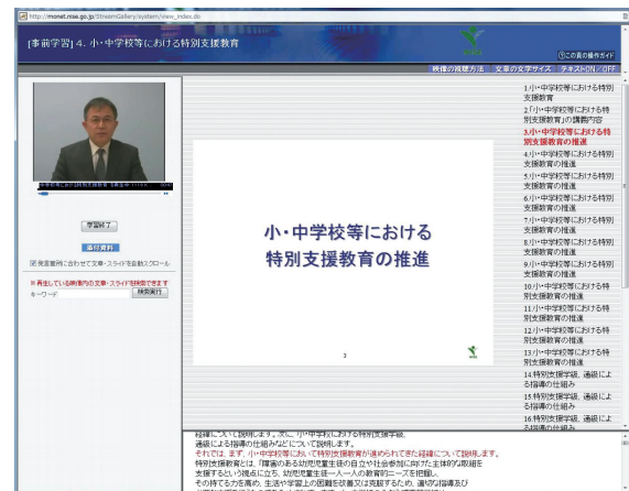
A page of an online lecture

These training contents are offered to schools and relevant institutions and require registration at NISE before they can be used.