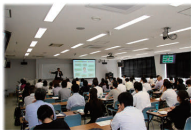
Lecture for specialized training

*Including participants who have completed the former program "Training Programs for Special Education intended for mid-career."