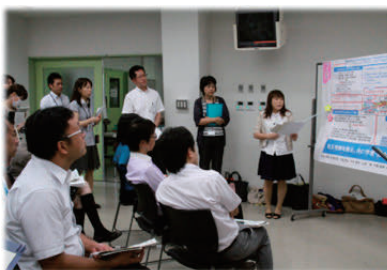
Group presentation for research outcomes