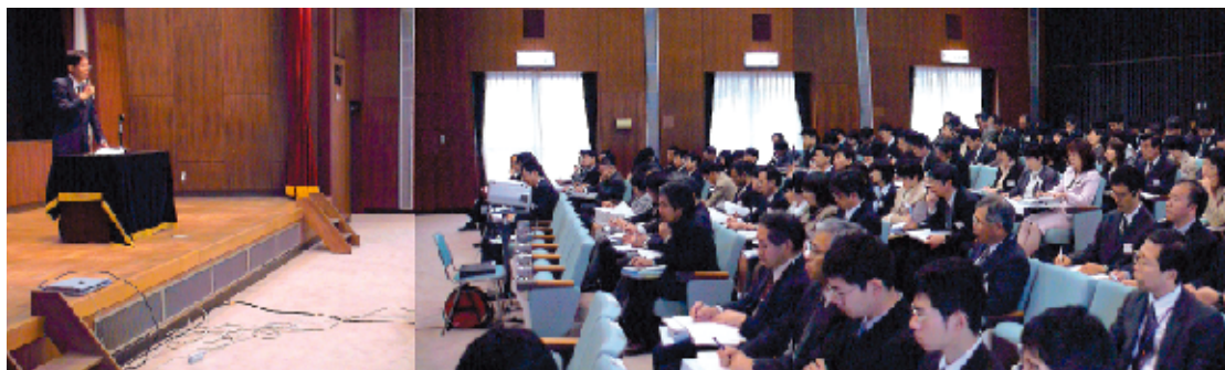
平成16年度特別支援教育コーディネーター指導者養成研修