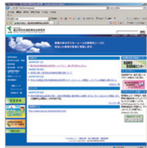
アクセシビリティ支援ツールを使用した 研究所Webページ