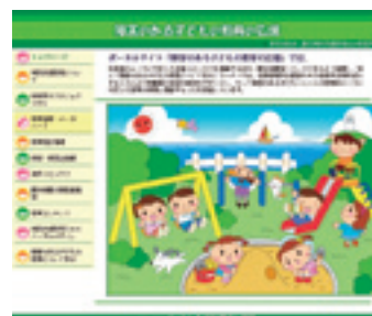
ポータルサイト 「障害のある子どもの教育の広場」

平成17年度より、アクセシビリティ向上を目的として、ウェブ・アクセシビリティ支援ツール（視覚障害者のための読み上げソフト等）を導入しています。このほか、携帯電話用のサイトでも情報提供を行っています。