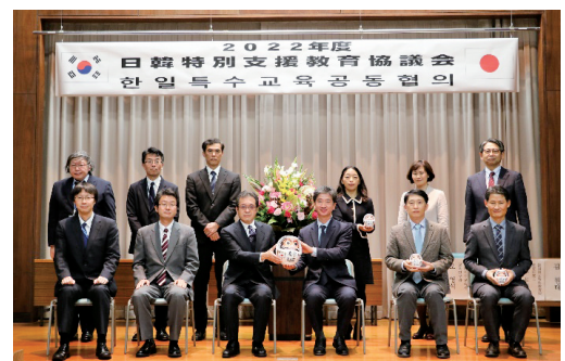
韓国国立特殊教育院との日韓特別支援教育協議会の様子

また、海外からの視察・研修を受け入れ、我が国の教育制度等についての情報提供を行っています。