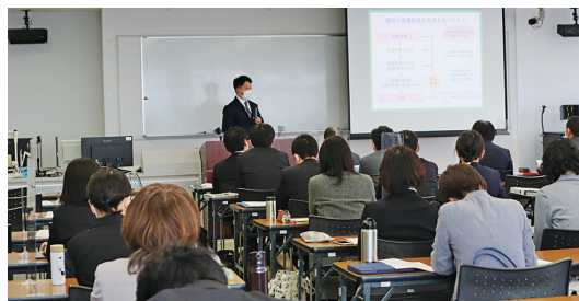
特別支援教育専門研修

各都道府県等における特別支援教育の指導的な役割を果たす教職員を対象とし、特別支援教育専門研修（視覚障害・聴覚障害・肢体不自由・病弱教育コース、発達障害・情緒障害・言語障害教育コース、知的障害教育コース：約2か月、計210名、オンラインと来所の組合せ）や、インクルーシブ教育システムの充実に関わる指導者研究協議会（ICT活用、高校通級：各2日、オンラインと来所の組合せ、交流及び共同学習：1日、オンライン、計220名）及び発達障害教育実践セミナー（1日、70名程度、オンライン）を実施し、指導者の養成を図っています。この他、全国特別支援学校長会との連携研修（特別支援学校寄宿舎指導実践協議会：1日、60名、オンライン）を実施しています。