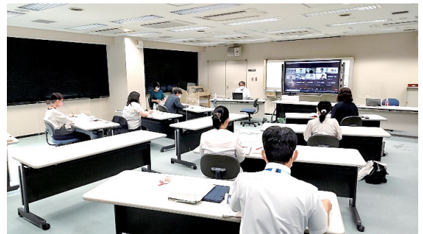
地域支援事業推進プログラムの様子 (ハイブリッドで開催)

今年度は全国から16の県市区町に参画いただいています。インクルーシブ教育システムの理解啓発の取組、地域の支援体制の構築、校内研修の推進など、研究所と協働し、それぞれの自治体の課題や目的に応じた事業に取り組んでいます。事業の成果は、各自治体において報告会等を実施して普及する他、事業報告書をNISEのウェブサイトに掲載するなどして普及します。