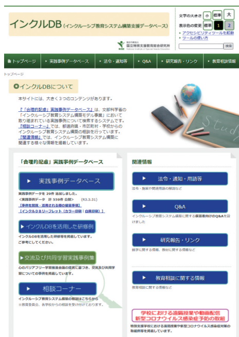
インクルDBのウェブサイト