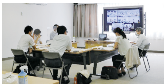
指導者研究協議会