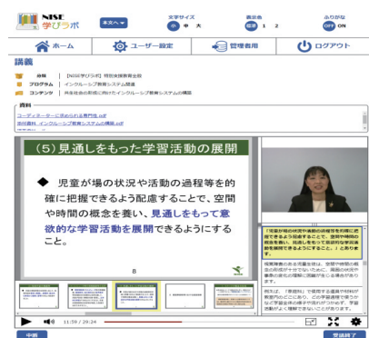
講義配信の視聴画面

障害のある児童生徒等の教育に携わる教員をはじめ、幅広い教員の資質向上の取組を支援するため、特別支援教育に関する講義を収録し、インターネットにより、学校教育関係者等へ配信しています。個人登録を行うことによって、およそ170の講義がパソコンやタブレット端末、スマートフォン等で、誰でも無料で視聴できます。目的に応じて系統的に学べるように、例えば、「特別支援学級（知的障害）の担任になったら」のような「研修プログラム」を提案しています。また、団体登録を行った教育委員会や学校等は、受講者のニーズに合わせて、いくつかの講義を組み合わせるなど、オリジナルの研修プログラムを設定し、教職員等の研修に活用することができます。