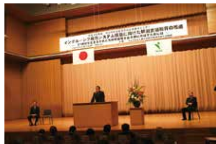
研究所セミナー開会式