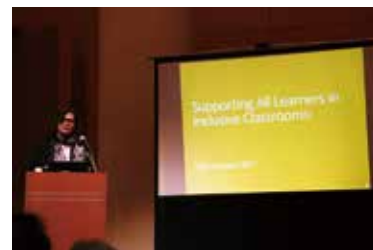
国際シンポジウム