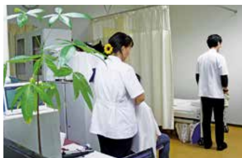
あん摩マッサージ体験