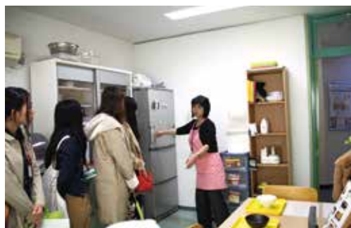
生活環境面での身近な配慮や支援の工夫の紹介