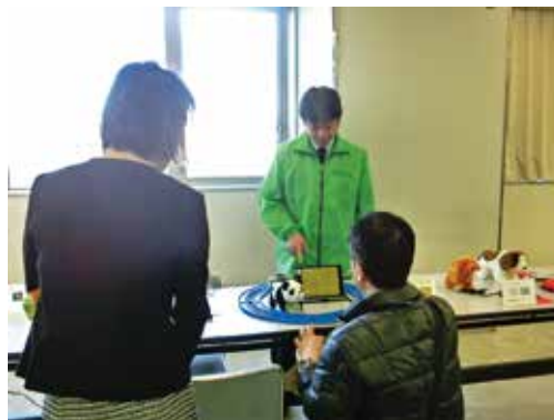
特別支援教育教材・支援機器等展示会