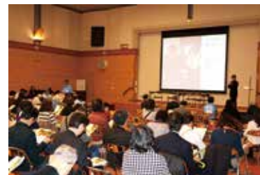
世界自閉症啓発デー in 横須賀