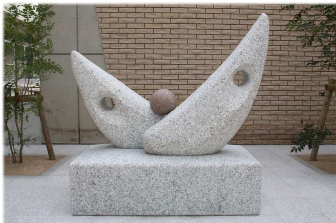
モニュメント「子どもとともに」