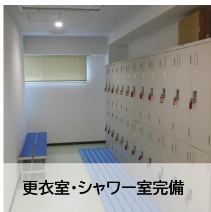
更衣室・シャワー室完備