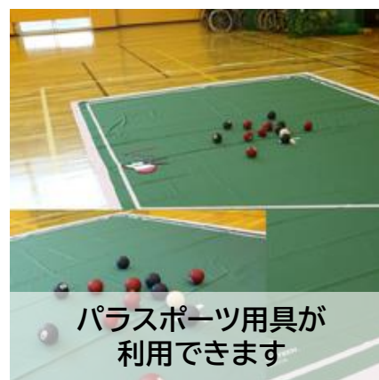
パラスポーツ用具が 利用できます