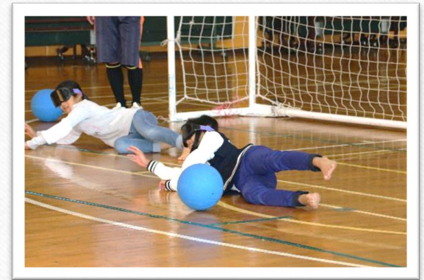
情報普及：研究所公開（ゴールボール体験）

幅広い関係者に対し、特別支援教育に関する理解の促進や総合的な情報収集・発信等を充実